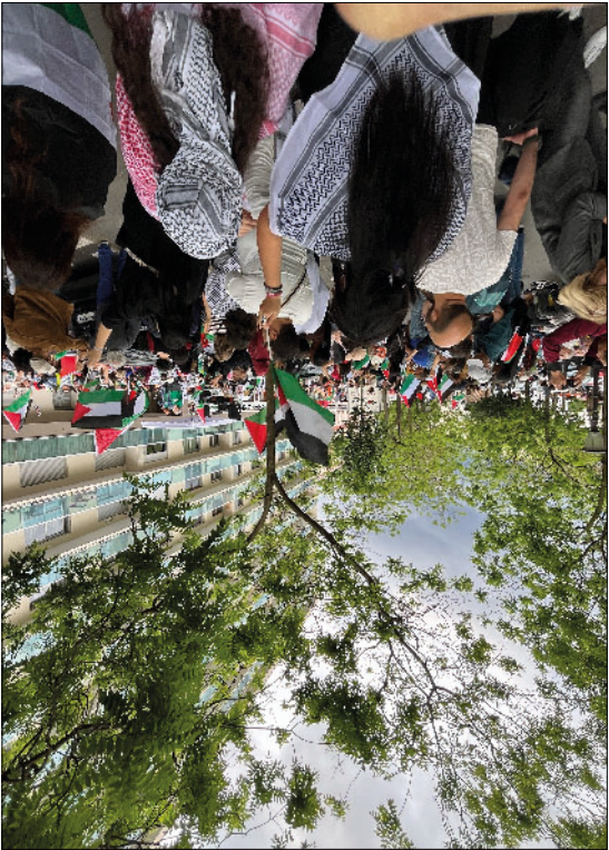
From the river to the sea, Palestine will be free (bdsmovement.net)