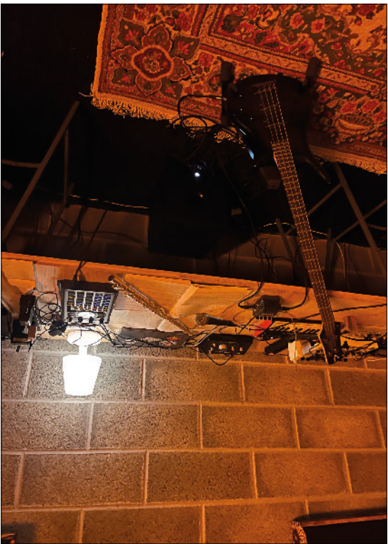
Résidence à L'Abri, création musicale au studio 7