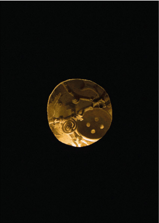
Attrape-Cœur, céramique, Salle Crosnier / 2024 @AlixDebraime