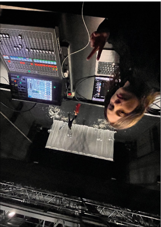
Composition musicale et scénographie, Théâtre de l'Usine