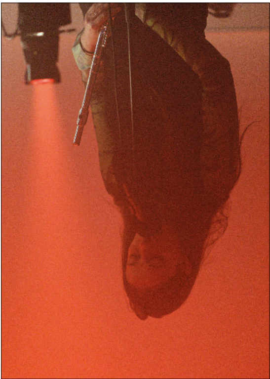
Concert Live, Sweet Tooth, Zürich / 2024 @BenjaminFannatter