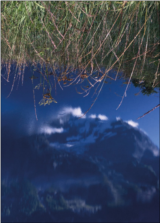
Paysage avant la musique, Oeschinensee (CH)